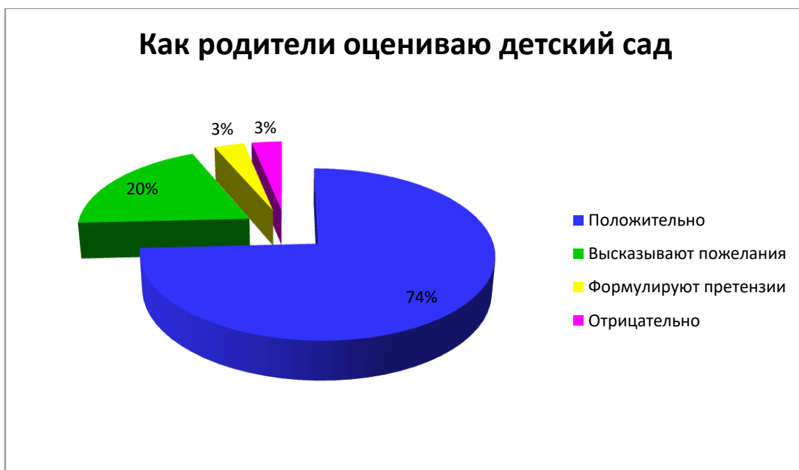
Диаграмма 1. Анкетирование родителей.

Из полученных данных анкетирования родителей (результаты мониторинга удовлетворенности родителями воспитанников детского сада качеством предоставляемых образовательных услуг) можно сделать вывод, что родители работой дошкольного учреждения и педагогов в основном удовлетворены – 94%, не удовлетворены – 6%